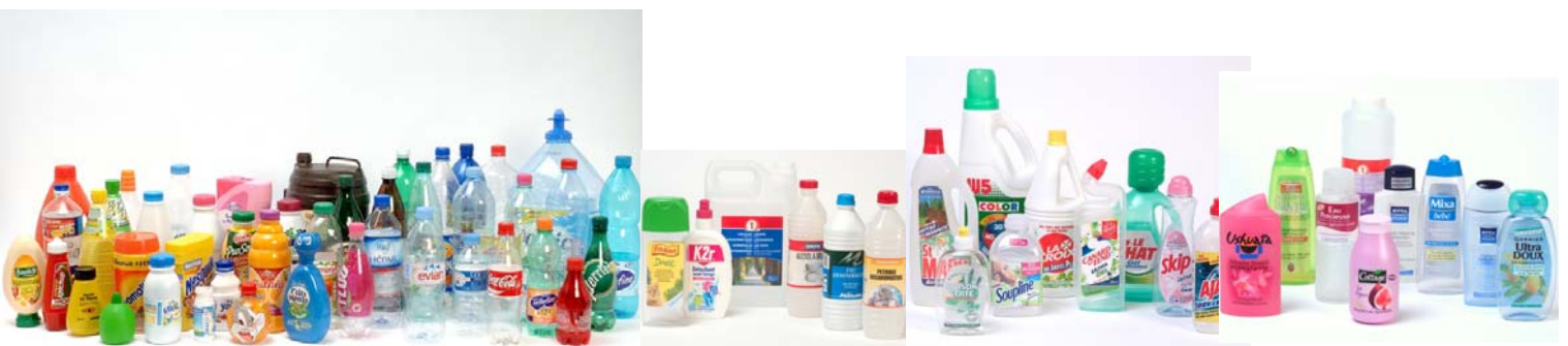
Les débouchés du PET